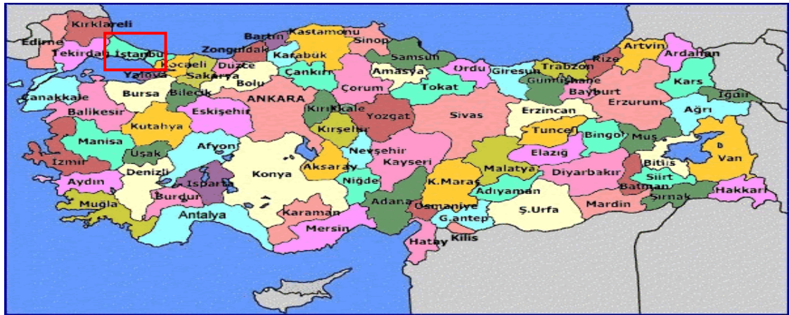
Harita 1 - İstanbul'un Konumu

İstanbul, Türkiye'nin en büyük kenti olup, 13 milyon kişiyi aşan nüfusu ile dünyanın da sayılı kentlerinden biri haline gelmiştir. Batı ile Doğu arasında köprü olma özelliği ile yerli ve yabancı sermaye için, bölgelerarası ilişki kurma ve bölgelere açılma yönünden önemli bir merkezdir. İstanbul Boğazı, Karadeniz'i, Marmara Denizi'yle birleştirirken; Asya Kıtası'yla Avrupa Kıtası'nı birbirinden ayırmakta ve İstanbul kentini de ikiye bölmektedir.